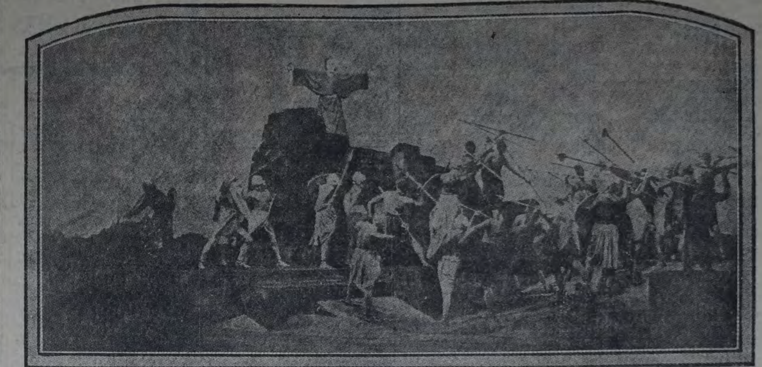
UNA ESCENA DEL QUINTO ACTO DE "SAUL", DE ALFIERI, EN LA CUAL SE PUEDE APRECIAR EL EXTRAORDINARIO EFECTO OBTENIDO EN EL MOVIMIENTO DE LAS MASAS DE PARTIQUINOS Y FIGURANTES.