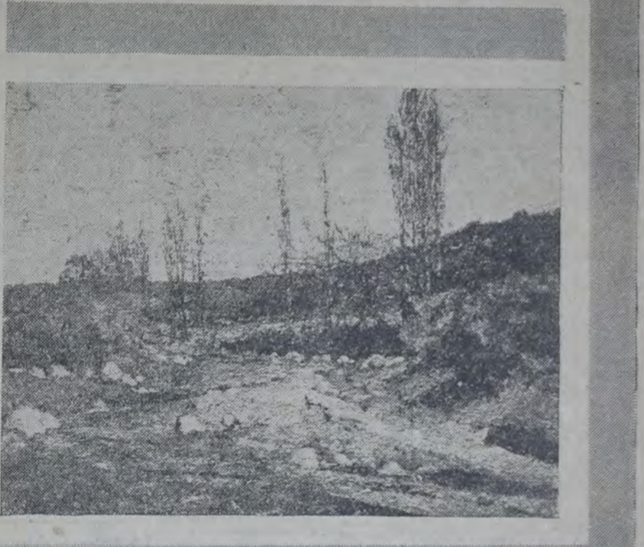
(Arriba) DIA GRIS. — (Abajo) MANANA PRIMAVERAL de Fernando Fader.