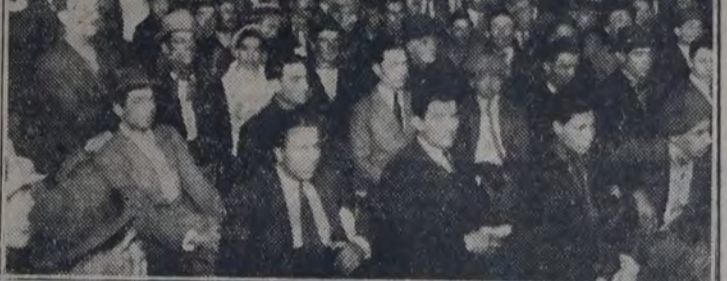
VISTA DEL LOCAL DEL CENTRO SOCIALISTA DE LA 3ª., DONDE LOS HUELGUISTAS REALIZARON UNA ENTUSIASTA ASAMBLEA

Cuentan para ello, por otra parte con el apoyo solidario de varios gremios, entre ellos los del Puerto, Choferes, Conductores de carros, guincheros y otros sindicatos que tienen alguna par-