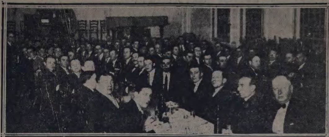
Concurrentes a la reunión de los gráficos socialistas

ral y material de los trabajadores y presagiar la próxima hora en que será posible desembarazar a los sindicatos obreros de las ligaduras de las sectas que todavía lo atan.